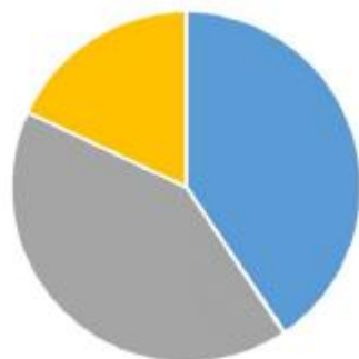
CREDORES POR QTDE

■ I - Trabalhista ■ II - Garantia Real ■ III - Quirografário ■ IV - EPP/ME